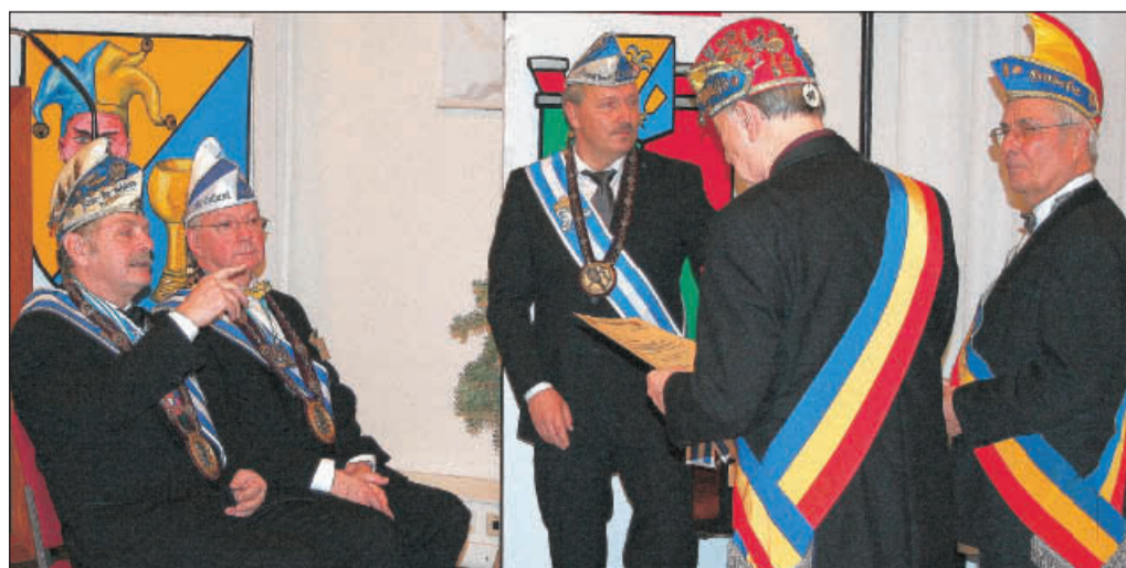
Gratulationscour vor Beginn des eigentlichen Stiftungsfestes der Schlaraffia Cell-Erika