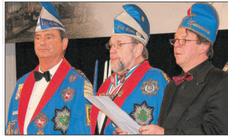
Mit dem Reichsschwert wird die Festburg geweiht. Drei Schlaraffen-Tenöre aus Hannover untermalen die Veranstaltung musikalisch.

Tross sind uhuertzlichst zu diesem gar gewaltigen Ereignis eingeladen. Uhuertzliche Willekum sind Euch gewiss!“ – Was sprachlich exotisch klingt, ist Tradition in der Celler Herrenrunde Cell-Erika. Man trifft sich ohne Verpflichtung wöchentlich zwischen Oktober und Mai, der so genannten