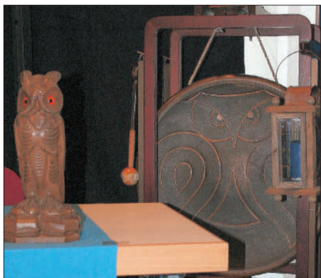
Ein Schlag auf das Tam Tam (rechts) läutet Beginn und Ende einer Sippung ein