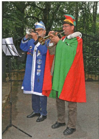
Fanfare im Tatenhausener Wald ...

halb Jahrhunderte nicht verloren gegangen, obwohl Schlaraffia im Dritten Reich verboten war. Man traf sich heimlich weiter. Zu besten Zeiten gab es zwischen Schweden und Argentinien 430 Schlaraffen-Reyche. Heute existieren noch 260, die durch ihre Mitglieder lebendig gehalten werden. Ein Reyche besteht aus Knappen, Junkern und Rittern, die - der Name lässt es schon ahnen - von jeher die (deutsche) Vereinskultur der Orden, Fahnen und Logen auf die humorvolle Schippe nehmen. „Humor auf hohem Niveau,“ betont Ritter Phil-Phras’, der im wirklichen Leben ... achsoo, das bleibt bei den Schlaraffen ja außen vor. Sie spielen ein Spiel als Kurzurlaub vom Alltäglichen - als Ritter „Macht ja nichts“, „Kieke-da“, „Störde-bäker“, „Ach soo“ oder „Na so was“. Herrlich, wenn sie sich vorstellen! „Wir sind nicht abgehoben,